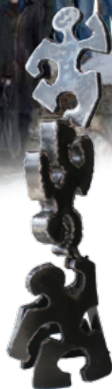
TROPHÉE "ACCOMPAGNATEUR BTP"

GEIQ BTP Pays de Savoie-Ain Siège social