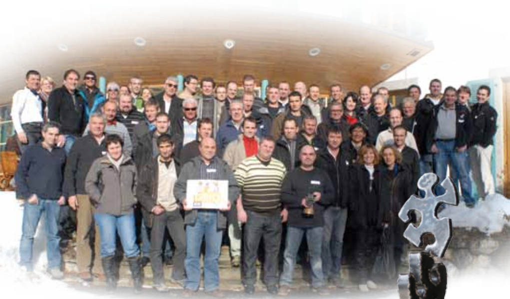
RASSEMBLEMENT DES "ACCOMPAGNATEURS BTP" - 14 JUIN 2010 / CHAMONIX